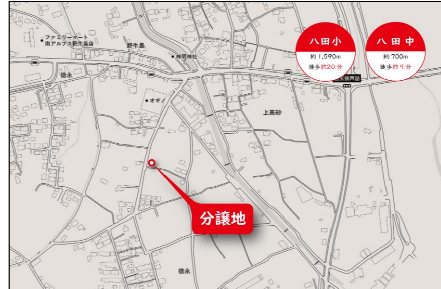
■ 周辺施設(オギノ南アルプス八田店) ■ 周辺施設(ファミリーマート南アルプス野牛島店)